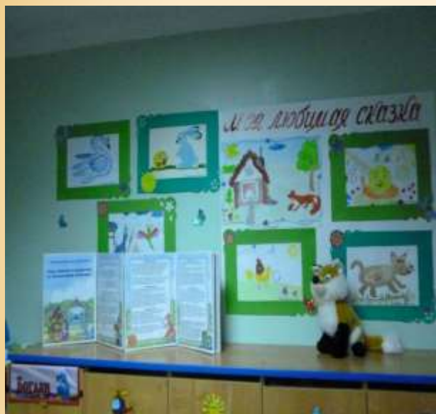
Выставка совместных рисунков «Моя любимая сказка».