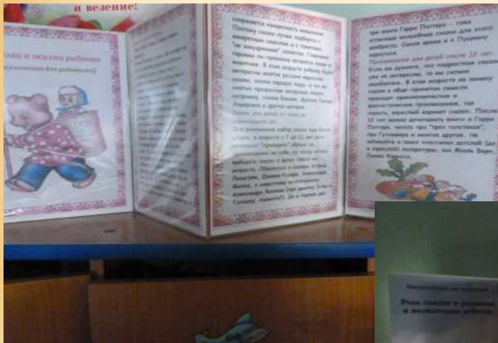
«Сказка в жизни ребенка»