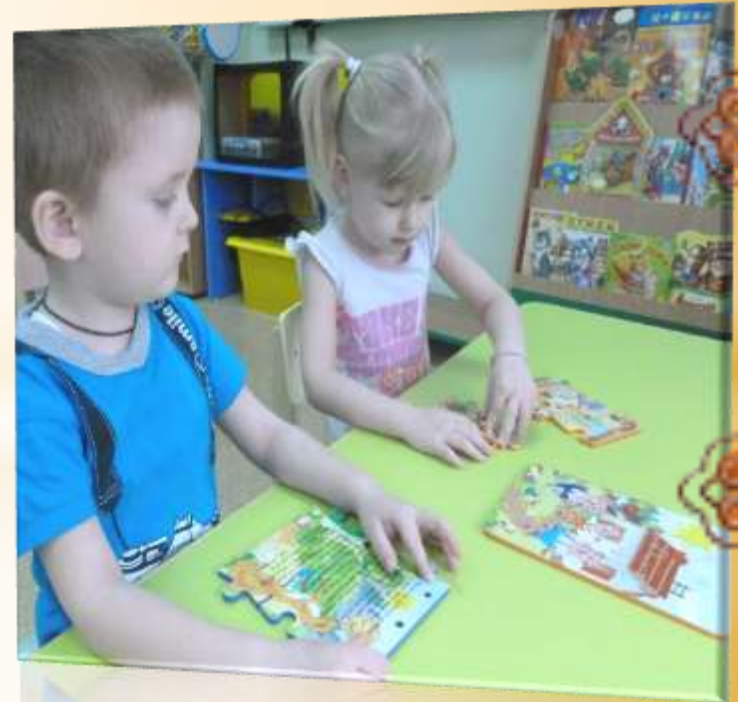
ПАЗЛЫ «Собери сказку».