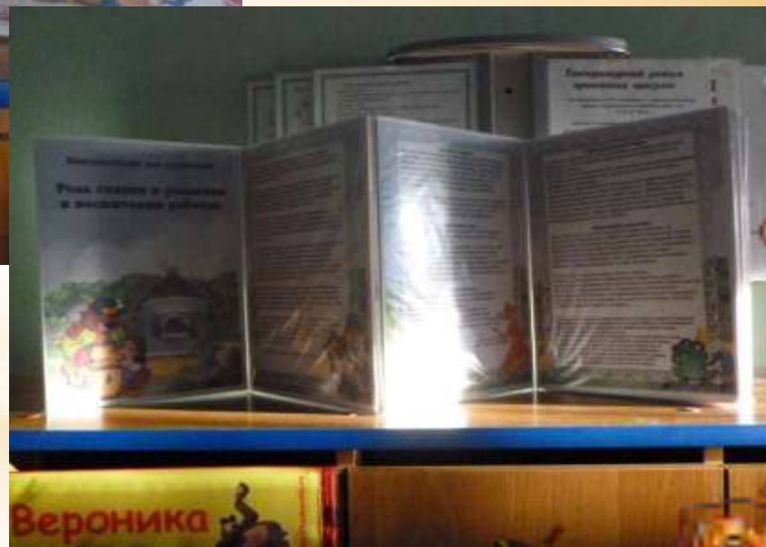
«Роль сказки в воспитании и развитии детей»