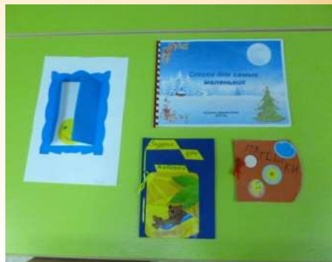
«Книжка своими руками».