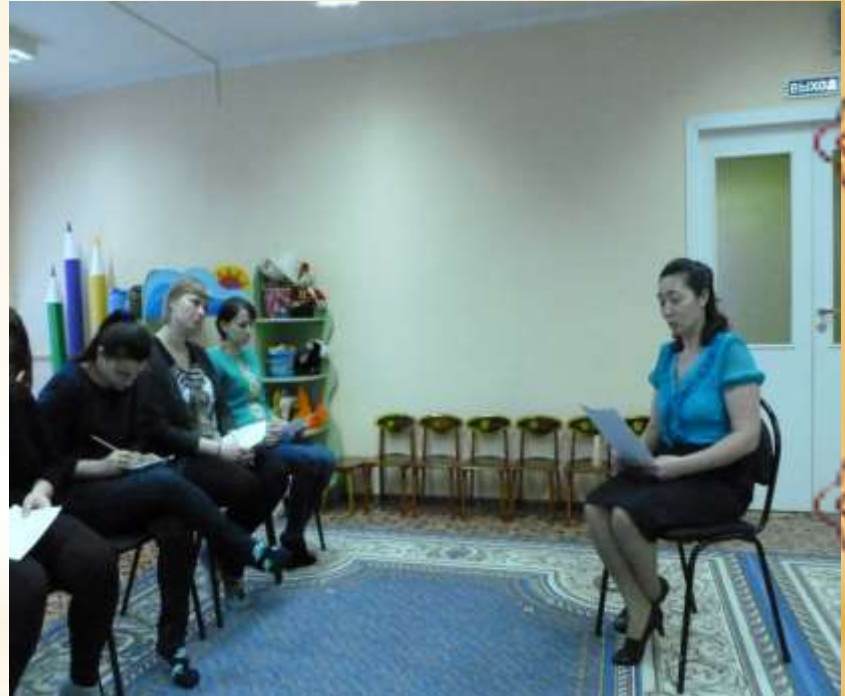
Консультации с родителями: «Обучаем детей рассказыванию»