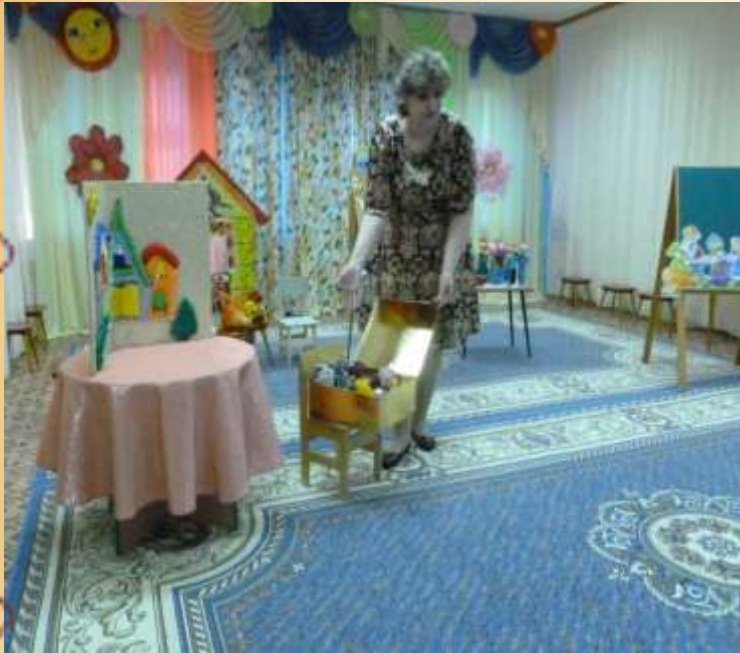
Мастер-класс «ТЕАТР СВОИМИ РУКАМИ»