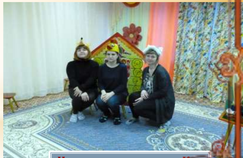
Инсценировка сказки «Кот петух и лиса»