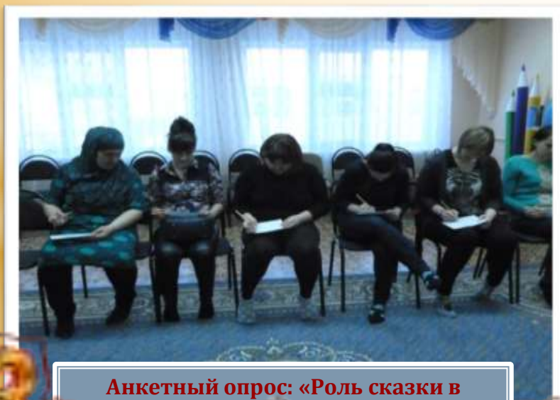
Анкетный опрос: «Роль сказки в речевом развитии ребенка».

В последние годы наблюдается резкое снижение уровня речевого развития дошкольников. Подобные отклонения, так или иначе, сказываются на последующем развитии и обучении ребенка. Одной из причин снижения уровня речевого развития является пассивность и неосведомленность родителей в вопросах речевого развития детей. Участие родителей в речевом развитии ребенка играет колоссальную роль. Именно поэтому в реализации проекта необходимо участие родителей. Стимулом для творческой деятельности ребенка служит театрализованная игра, доступная с самого раннего возраста. Необходимость систематизировать её в едином педагогическом процессе очевидна. Увлечённость детей театрализованной игрой, их внутренний комфорт, раскованность, лёгкое не авторитарное общение взрослого и ребёнка.