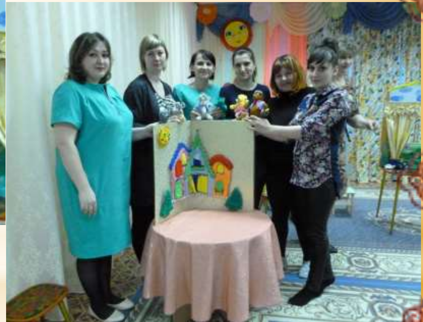
Подготовка игры - драматизации «Кот , петух и лиса».