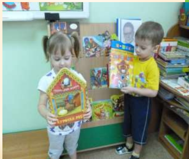
Создание в группе библиотеки сказок с качественным иллюстративным сопровождением.