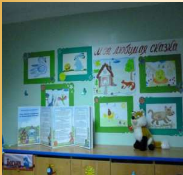
Выставка совместных рисунков «Моя любимая сказка».