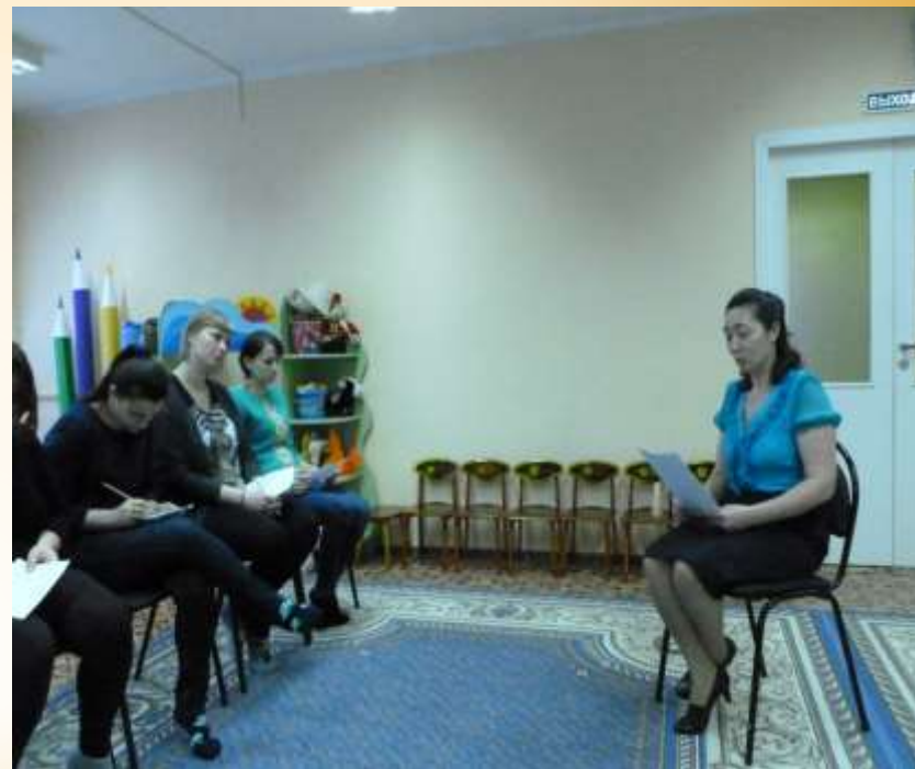
Консультации с родителями: «Обучаем детей рассказыванию»,