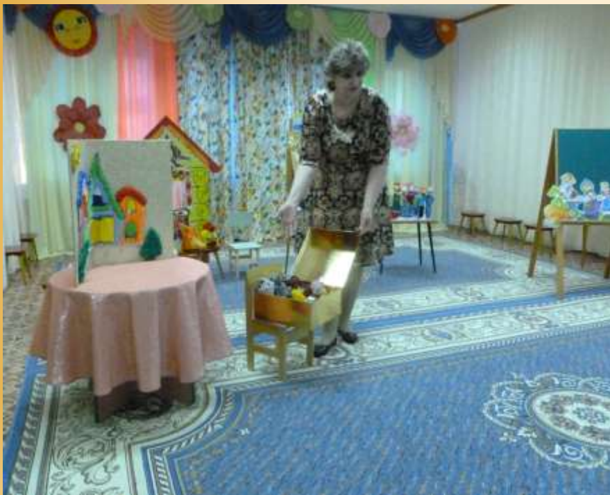
Мастер-класс «ТЕАТР СВОИМИ РУКАМИ»