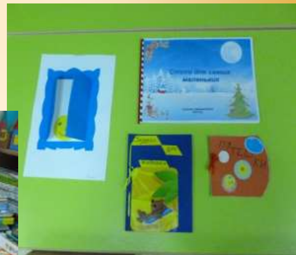
«Книжка своими руками».