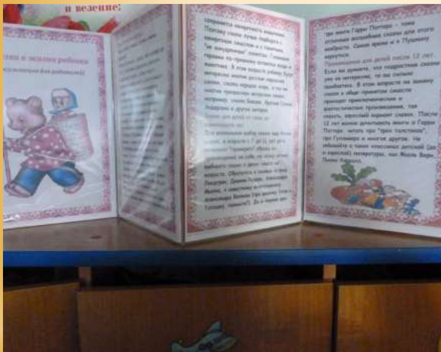
«Сказка в жизни ребенка»