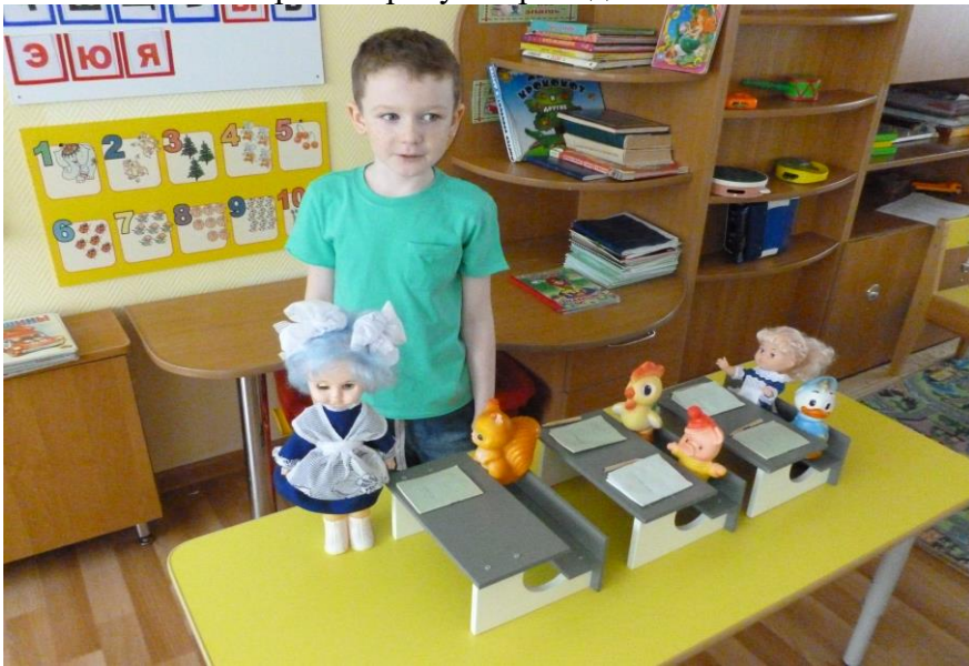
Сюжетно –ролевая игра «Школа»