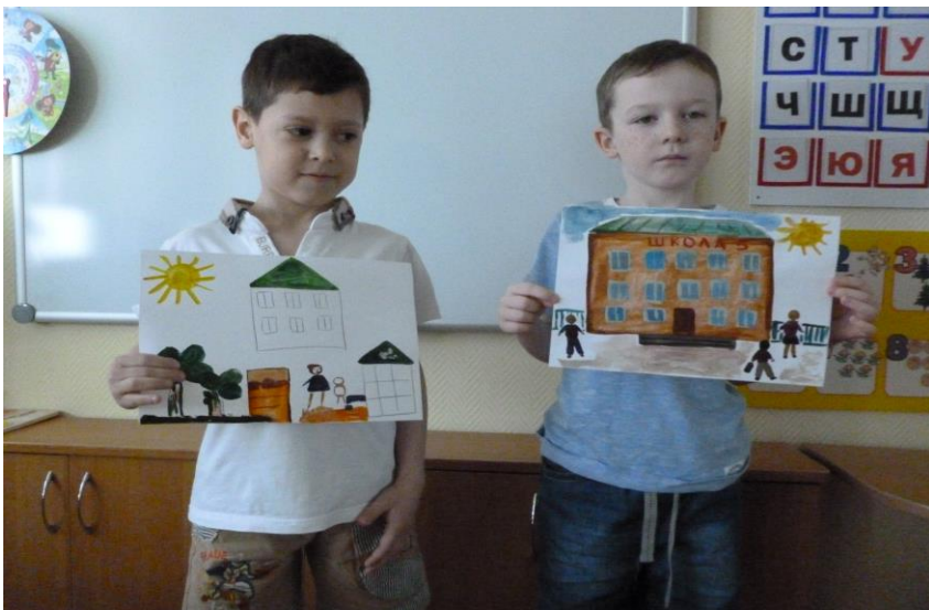
Нарисуй, как ты представляешь школу.....