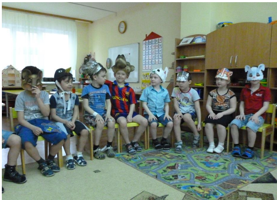
Игра: «Лесная школа».

Проект «Будущий первоклассник!» поможет нашим детям, будущим первоклассникам, адаптироваться к новым условиям социальной роли школьника. А готовы ли они к новой роли учеников и одновременно одноклассников, покажет время. В дальнейшем я буду сотрудничать с учителем 1 класса и интересоваться успехами моих воспитанников.