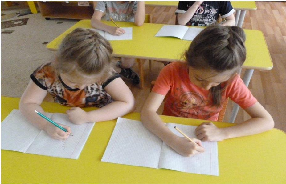
«Сейчас мы будем учиться рисовать разные узоры» (Рисуем по клеточкам).