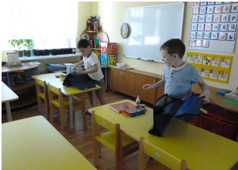
Игра: «Собери портфель»