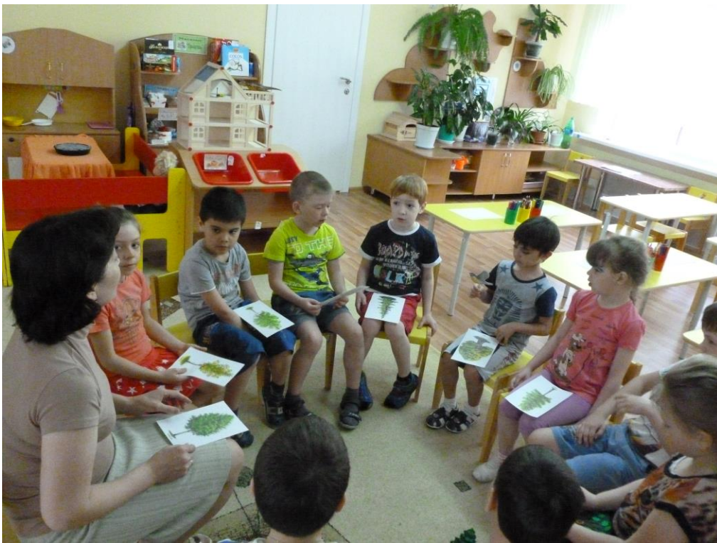
Игра: «Птичка» (Виды деревьев)